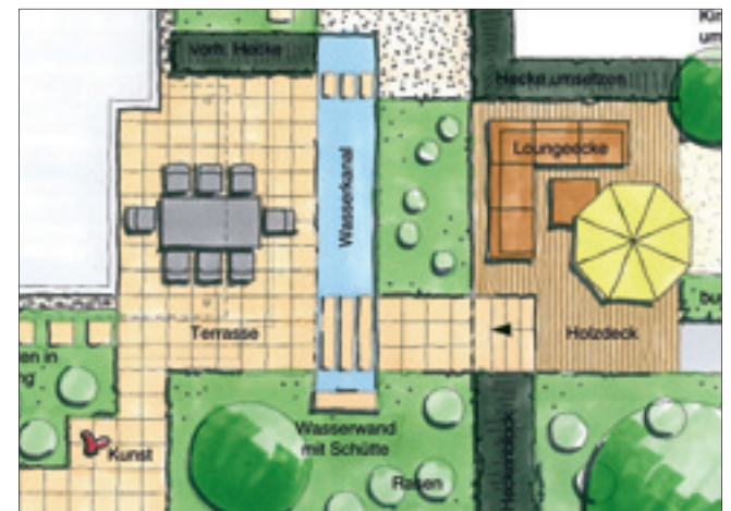
Der sichere Weg zur vollendeten Anlage