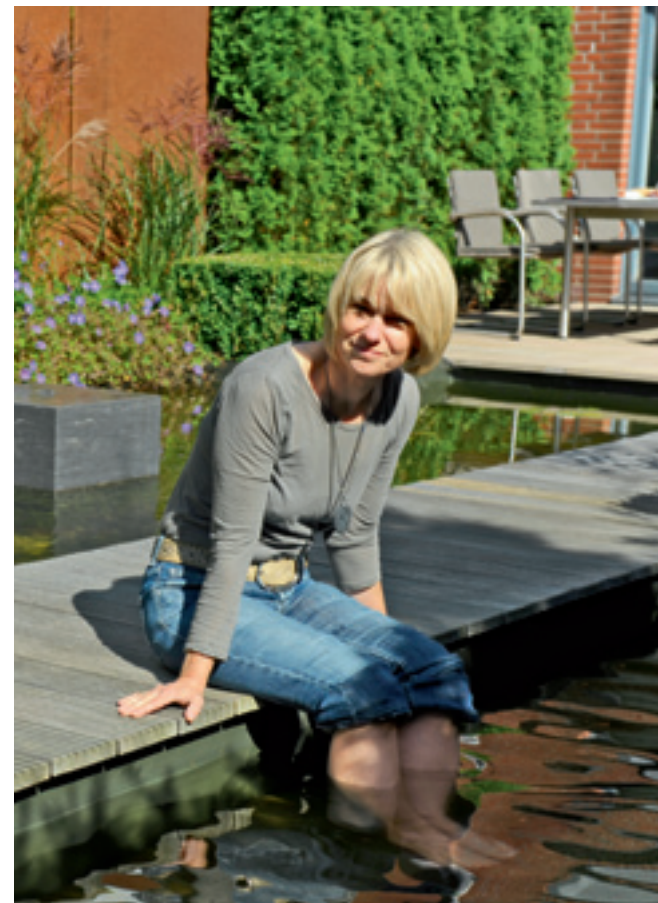
Mein Garten ist mein Zuhause.

gerade Linien und reduzierte Formen?“ Designfreunde und Ästheten verbindet die Liebe zu klaren Formen, doch während der Designfreund extrovertiert ist, sucht der Ästhet einen Rückzugsraum. Naturfreund und Genießer bevorzugen organische Formen. Nach der Orientierung mit Hilfe der Gartentypen folgt die thematische Ausgestaltung. So kann ein Garten für Ästheten als englischer Heckengarten oder als japanischer Teegarten gestaltet werden. Haben Sie Ihren Gartentyp schon gefunden? Wenn nicht – auf unserer Homepage finden Sie unseren Gartentypentest. Gerne beraten wir Sie auch persönlich.