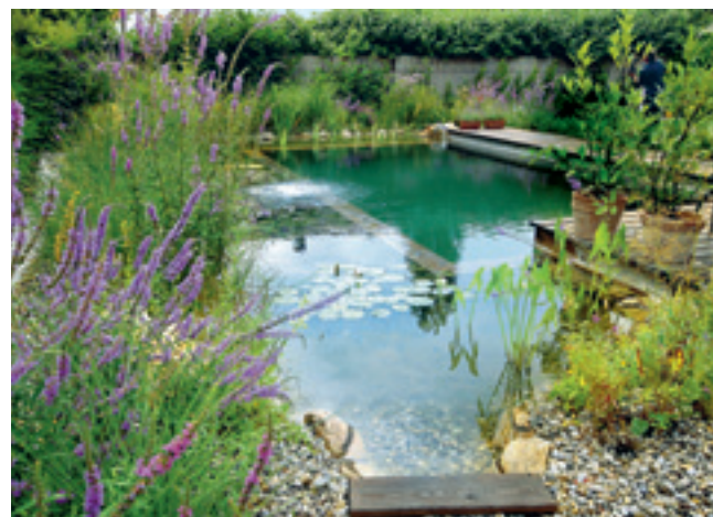
Der Swimming-Teich – pure Lebensqualität