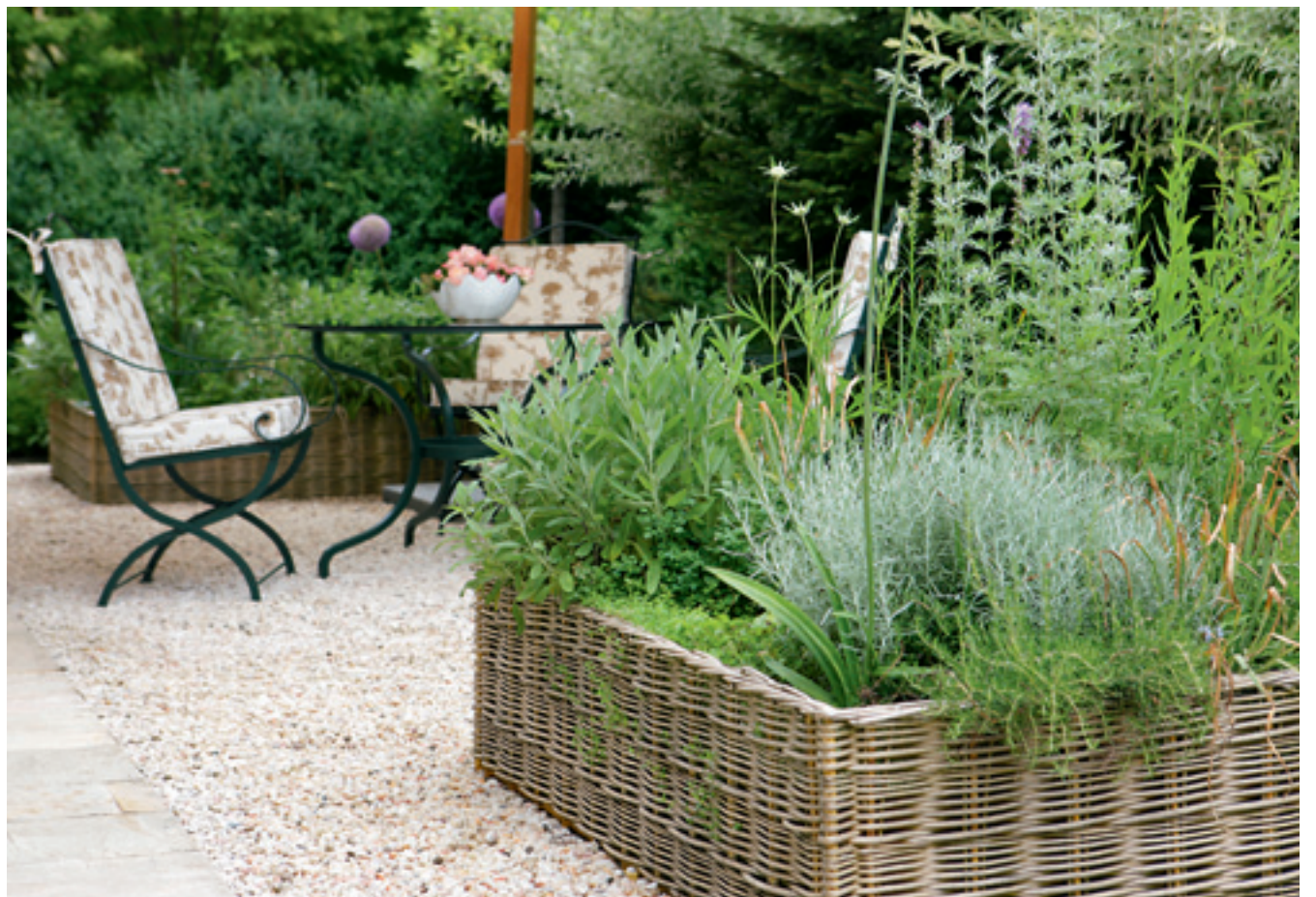
Mit Weidengeflecht eingefasste Hochbeete bieten viel Platz für Kräuter, Salat und dekorative Stauden.

Die vorbereitete Springform mit zwei Drittel des Teiges auslegen, mit dem restlichen Drittel den Rand ausfüllen. Den Boden mehrmals mit einer Gabel einstechen. Jetzt den Boden mit den Äpfel auslegen. Die Tarte in den vorgeheizten Backofen bei 180°C auf die zweite Schiene von unten stellen und ca. 60 Minuten backen. Kurz bevor die Tarte fertig ist, das Quittengelee in einem Topf bei geringer Hitze so lange erwärmen, bis es flüssig ist. Die Tarte aus dem Ofen holen und aus der Springform lösen. 1 Teelöffel Zucker darüber streuen und das flüssige Gelee darüber pinseln. Am besten mit geschlagener Vanillesahne noch warm genießen. Viel Spaß beim Nachbacken!